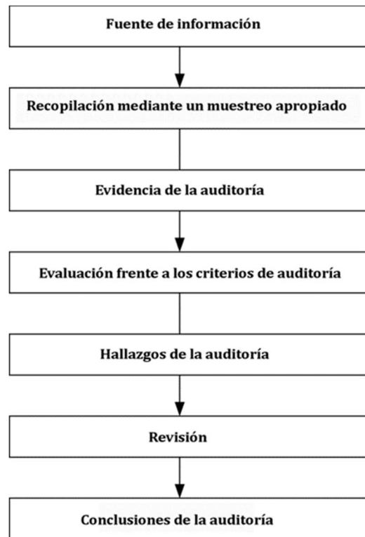
Figura 2 – Visión general de un proceso típico de recopilación y verificación de la información

La figura 2 proporciona una visión general de un proceso típico, desde la recopilación de información hasta las conclusiones de la auditoría.